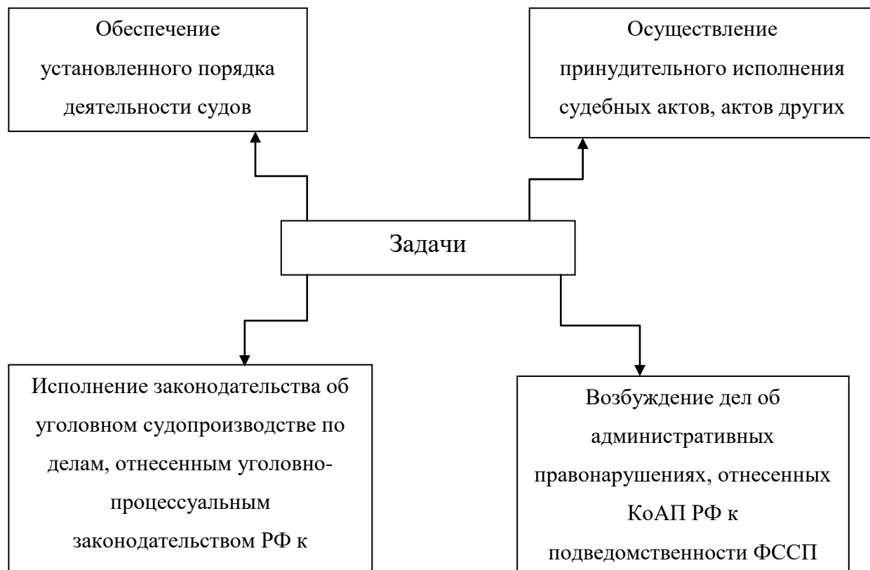
Рисунок 3 – Задачи Федеральной службы судебных приставов РФ

Допускается использовать рисунки со статистическими данными, оформленными в виде диаграмм; такие рисунки должны быть подписаны с указанием источника ( Например: по данным ФССП).